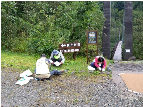
別当出合除去作業（9/23） （登録ボランティア一斉除去）