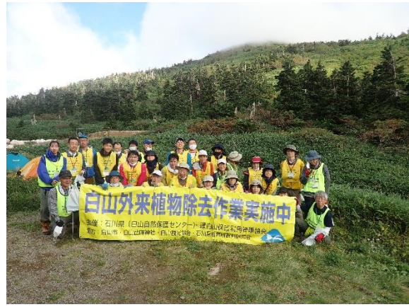
南竜ヶ馬場除去作業（9/10～11）