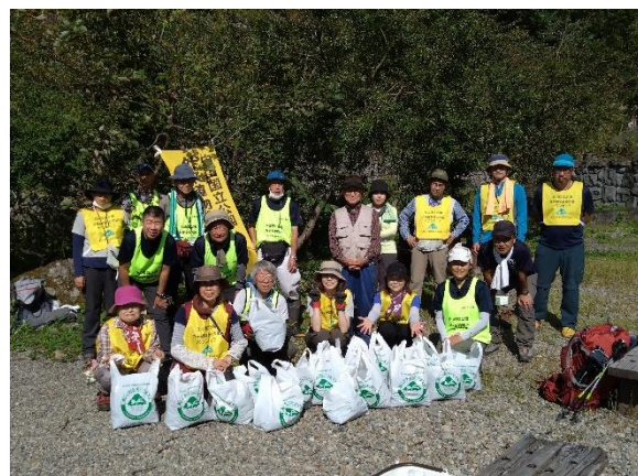
別当出合・砂防新道場除去作業（10/2） （登録ボランティア一斉除去）